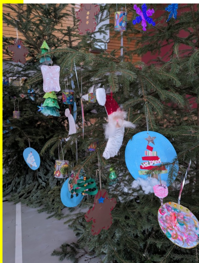
Décorations de Noël